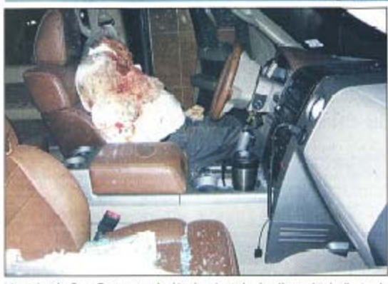
Nuevo Laredo, Tam.- Con cuernos de chivo fue ejecutada el recién nombrado director de Securidad Pública